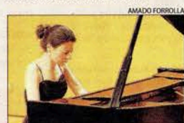
Concert, ahir, a l'Auditori.