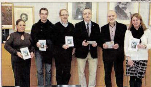
La setmana cultural del Conservatori es va presentar ahir.

■ Exposicions: Música en silenci i concurs d'arts plàstiques.